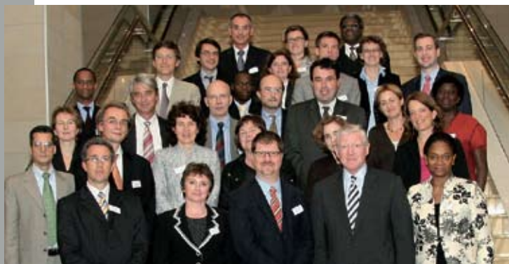
Réunion des donateurs de l'IFFIm et des membres du Conseil de GAVI, organisée à Cape Town, en Afrique du Sud, le 27 novembre 2007